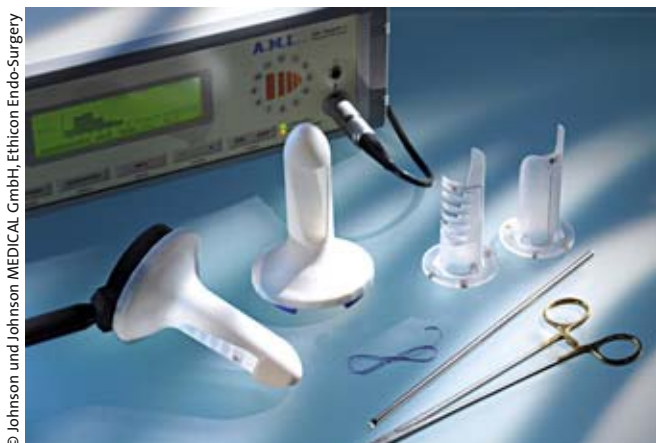
Abb. 4: Instrumentarium zur Durchführung einer HAL.